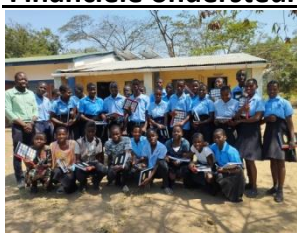
Klas 2 met gegeven schoolmateriaal

Door de financiële ondersteuning konden we weer 50 leerlingen helpen met school/examen geld en schoolmateriaal. Van klas 2 die examens deden is 89% en klas 4 83% geslaagd. De donatie van Wiskunde boeken in 2023 heeft goede resultaten geleverd: in 2023 Wiskunde examens 57% en in 2024 examens 80% geslaagd.